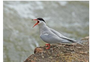
Sterne Pierregarin ( M. Foucard )

La Loire serpente, creuse, érode, inonde... Toutes les conditions sont réunies pour accueillir de nombreuses espèces, comme le Castor pourtant disparu depuis le début du XXème siècle, la Piloselle de Loire, présente uniquement en bord de Loire et nul par ailleurs dans le monde, ou les Sternes, des oiseaux nichant sur les îles de la Loire. Attention : celles-ci sont susceptibles d'abandonner les nids et poussins en cas de dérangement, notamment dû à la fréquentation.