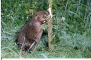
Castor d'Europe ( D. Lagrèze )

Sur un parcours de plus de 1000 km, prenant sa source au Mont Gerbier-de-Jonc (en Ardèche) et se jetant dans l'Océan Atlantique à St Nazaire (Loire Atlantique), la Loire est ici entre Vitry et Decize, l'un des tronçons dont la dynamique est la plus active, autrement dit : là où le fleuve est resté vif et sauvage.