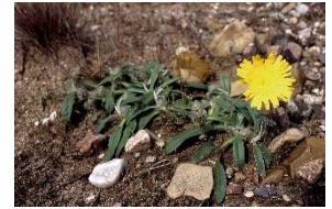
Piloselle de Loire (CENB)

Sur un parcours de plus de 1000 km, prenant sa source au Mont Gerbier-de-Jonc (en Ardèche) et se jetant dans l'Océan Atlantique à St Nazaire (Loire Atlantique), la Loire est ici entre Vitry et Decize, l'un des tronçons dont la dynamique est la plus active, autrement dit : là où le fleuve est resté vif et sauvage.